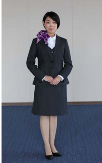
冬用（スカーフ：パープル）