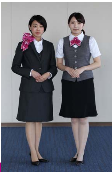
左：冬用（スカーフ：やまもも色）

デザインや素材については、女性職員からの要望を取り入れ、冬用・夏用とも従来の制服より格段に軽量化され伸縮性にも富んだ素材を使用し、動きやすく機能的なデザインとしました。なお、素材は耐久性にも優れており、家庭での洗濯も可能です。