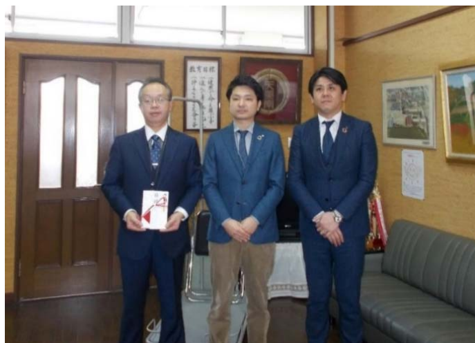
贈呈式の様子 小学校に折りたたみチェア等を寄贈

私募債を発行されるお客さまから受取る手数料の一部を活用して、SDGs達成に向けた取組みや新型コロナウイルスへの対応を実施している団体及び基金に対して寄贈するもので、お客さまの資金調達と社会貢献活動を同時に支援する商品です。