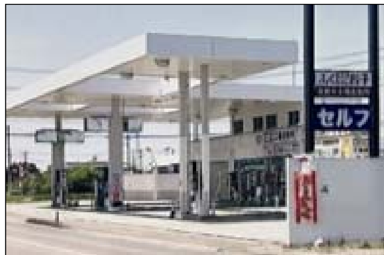
事業拡大と地域社会のインフラ維持

M&Aの成立により、お客様の事業規模拡大につながるとともに、ガソリンスタンドの継続営業は地域社会のインフラ維持に貢献する取組みとなりました。