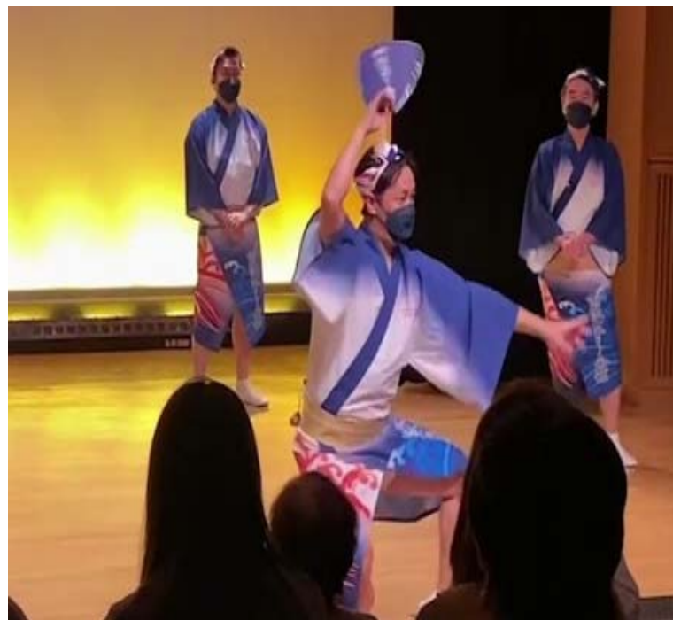
徳島阿波踊り会館での実演

資格を生かしたセミナー講師や、特技を生かした観光客向け阿波踊りの実演など、様々な副業を行っています。