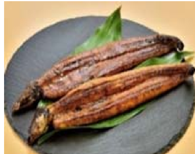
地域食材の販路拡大

販路を拡大したいお客様と地域食材を有効に活用したい飲食事業者、双方のニーズにお応えし、地域経済発展にも寄与しております。