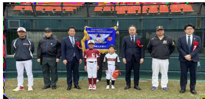
U-9野球チームの選手と記念撮影