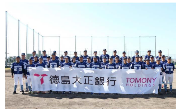
徳島インディゴソックス