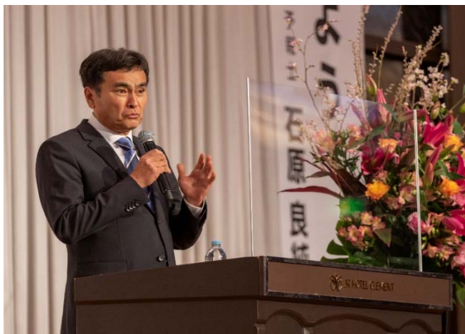
とくぎん生涯学習財団講演会