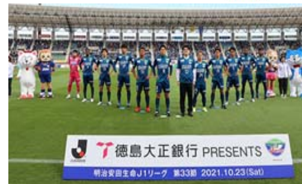
徳島ヴォルティス スポンサーマッチ