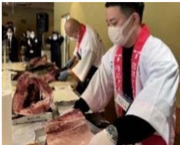
近大マグロ解体ショー