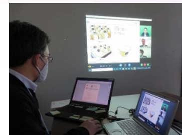
「トモニmini商談会」の様子

トモニHDグループと連携した商談会の開催や、「トモニ販路拡大サポート」等によるお取引先紹介により、お客様の販路拡大、生産性向上を支援しています。