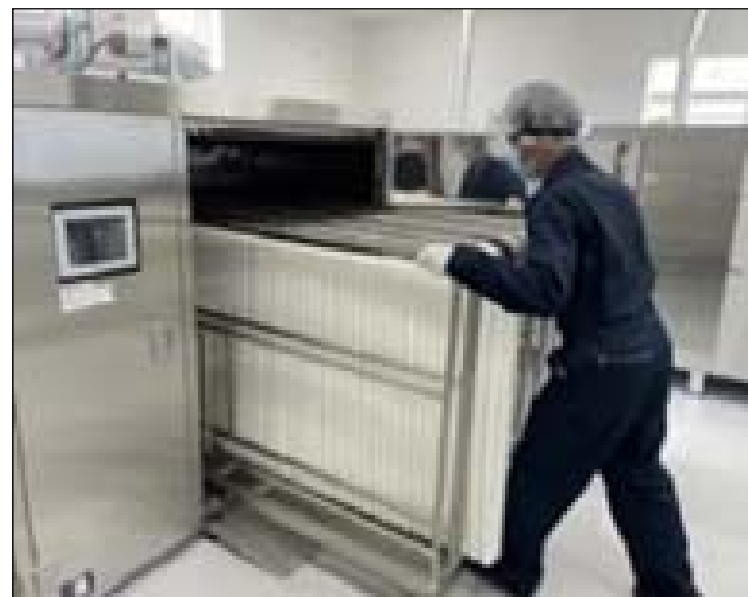
クリーニング事業開始に伴う設備導入

高齢化社会の進展を背景に更なる高まりをみせる医療・介護業界の需要に対応し、業界全体のサービスの向上を通して、地域経済発展に寄与しています。