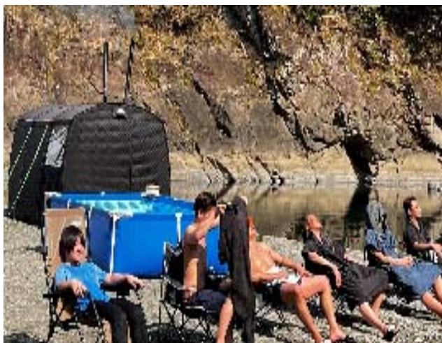
バイオコークス使用のテントサウナ